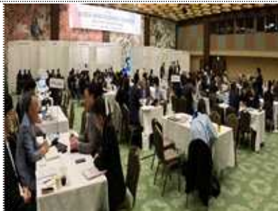
B2B 전시회 전경