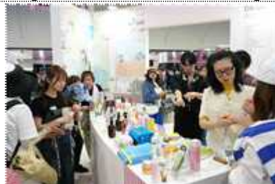
MD 대리상담 모습