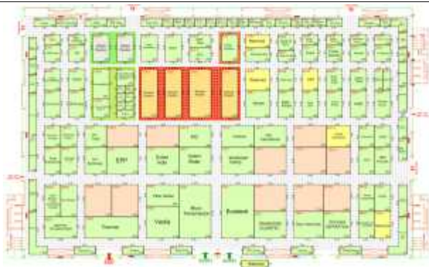
한국관 위치 홀 전체도면(Hall 6)