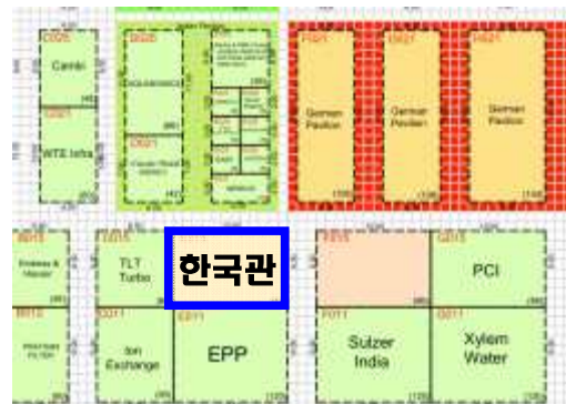
한국관 세부 위치(96m 2 )