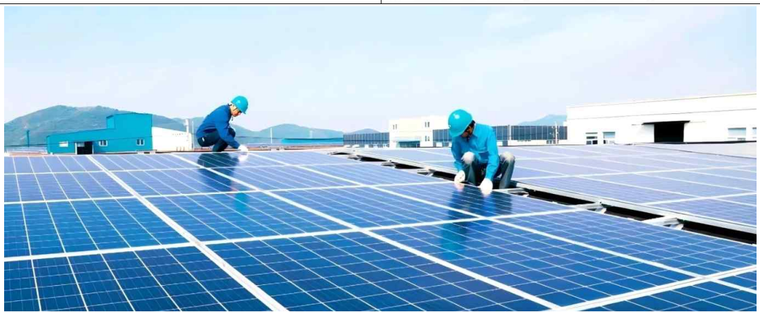
○○이엔지 태양광패널 및 증착공정