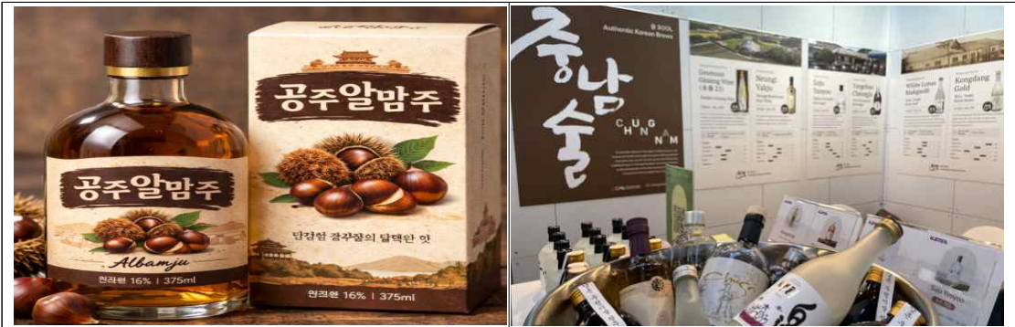
2025년 공주알밤주 제품 및 전시회 참가 모습

◦ 국내 유력 국제 인증 전시회 참가를 통해 '공주알밤주'의 브랜드 가치를 제고하고, 실질적인 B2B 거래선 확보 및 B2C 판매 채널 확장을 통해 지속 가능한 성장 기반마련하고자 합니다.