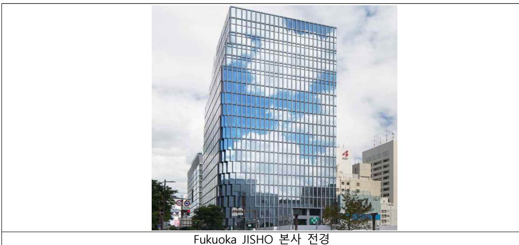
Fukuoka JISHO 본사 전경