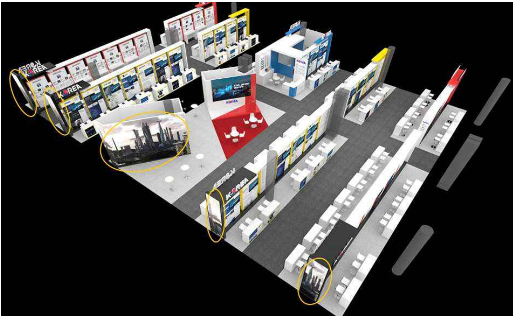
[CES 2026 통합한국관 조감도 및 부스 디자인(참고용)]