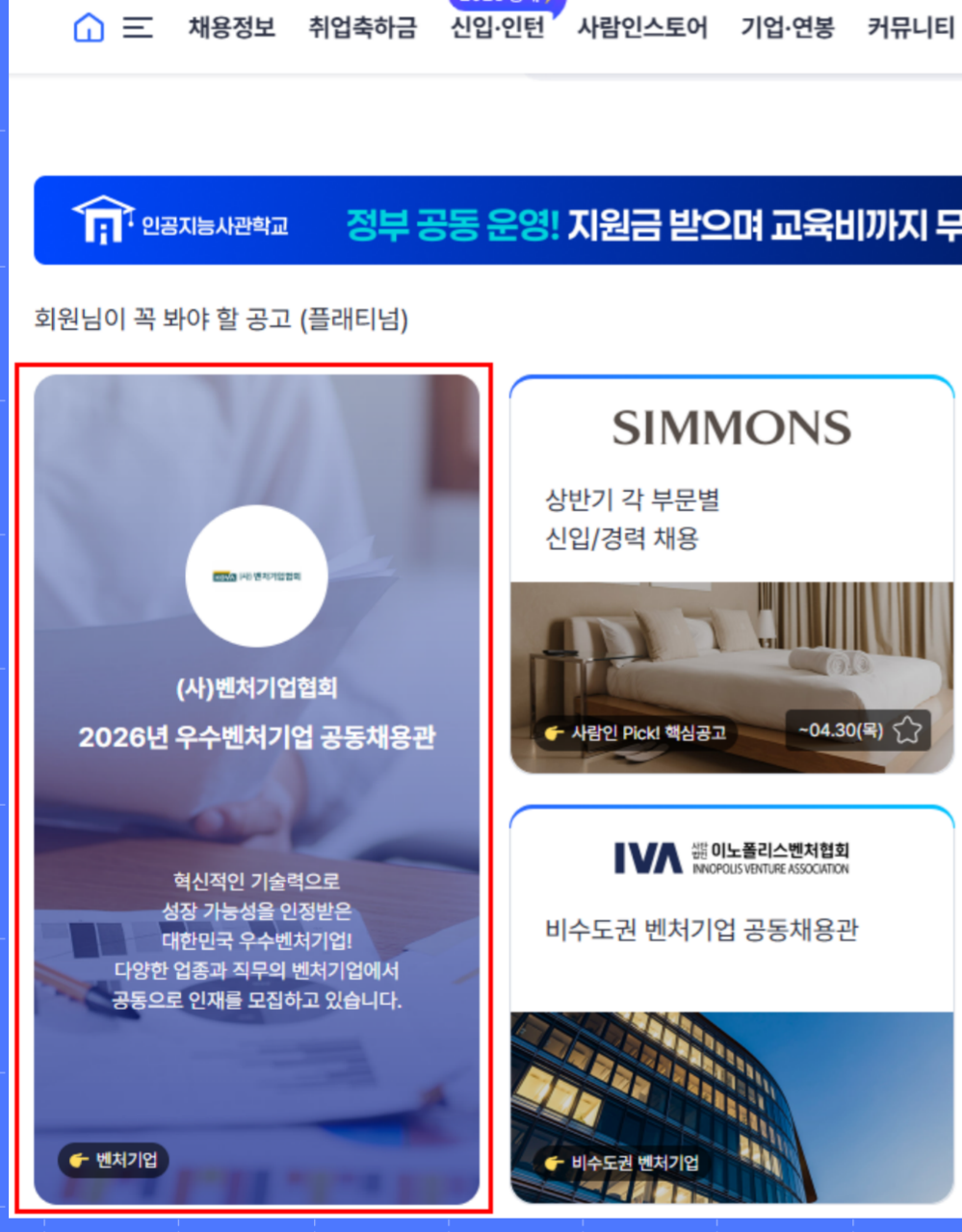
사람인 채용관 (플래티넘 플러스)