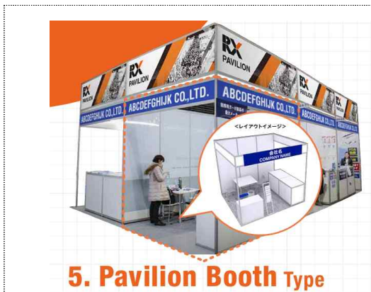
5. Pavilion Booth Type