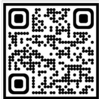
프렙 아카데미 인스타그램