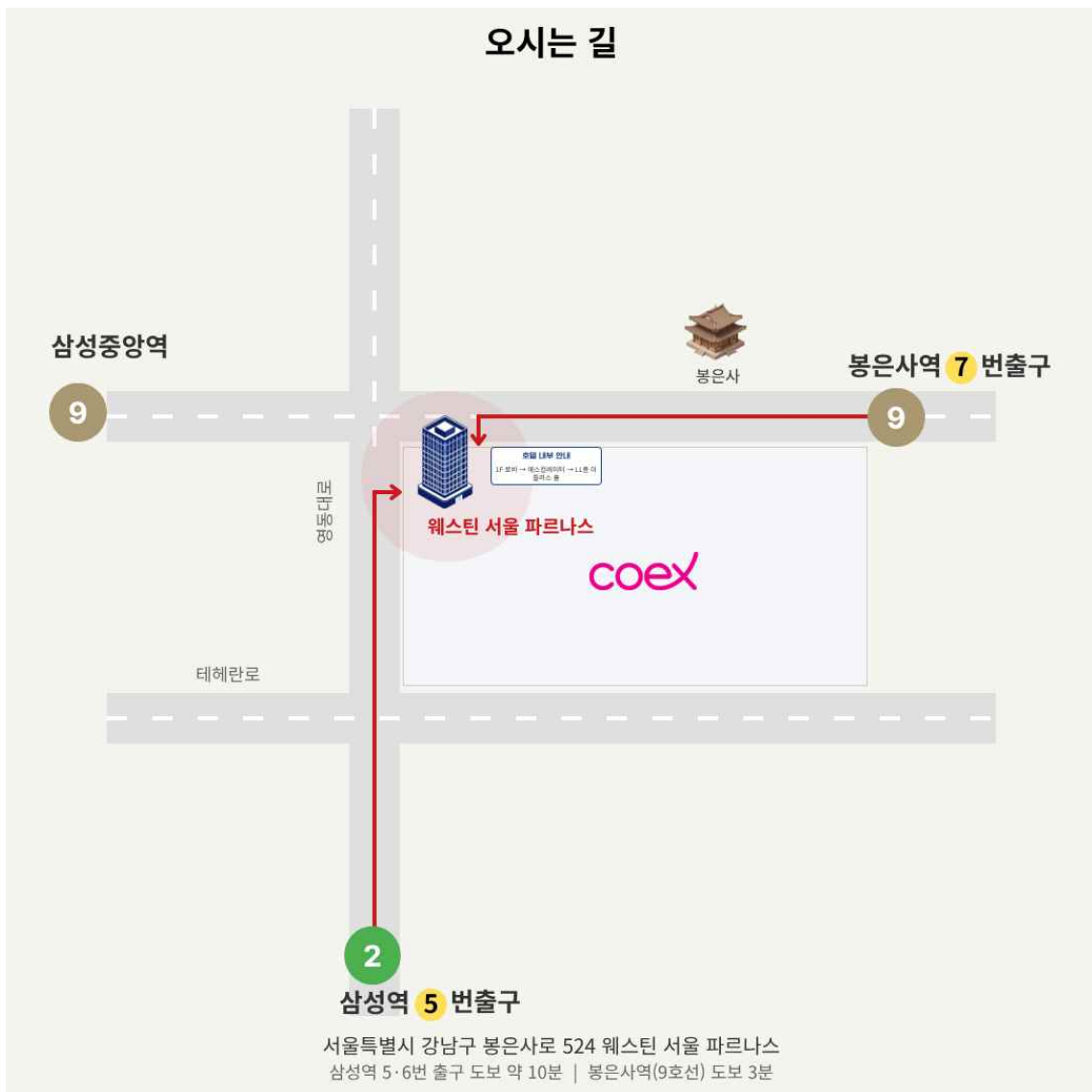
▲ 웨스틴 서울 파르나스 찾아오시는 길